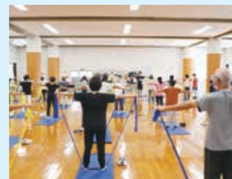
ふるさと納税制度の補助金を活用した市民向け公開講座(上)とアントレプレナーシップ育成プログラム(右)の様子。

なお、名古屋市は、ふるさと納税を活用した大学の地域貢献活動の範囲を広く認めているため、大学は補助金*4を柔軟に使用できる。名城大学は、市民のリスクリングに資する公開講座や、次世代の起業家を育てるアントレプレナーシップ育成プログラムを実施。地域の活性化を図るとともに、このような共同事業を通じて名古屋市との連携を強化している。